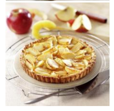
72282 - Tarte aux pommes BIO, la pièce de 500 g