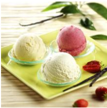
74600 - crème glacée vanille Bio (le bac de 450 ml)