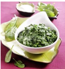
70389 - Epinards en branches à la crème BIO, le sachet de 600 g