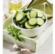
70388 - Courgettes BIO, le sachet de 600 g