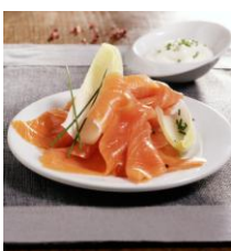
60520 - Saumon fumé BIO Atlantique d'Irlande, la pièce de 100 g