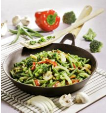
70387 - Poêlée de légumes BIO, le sachet de 600 g