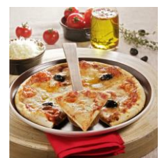
60521 - Pizza aux 3 fromages BIO, la pièce de 350 g