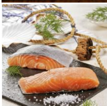
64254 - 2 pavés de saumon Atlantique BIO, le sachet de 250 g